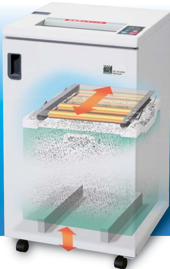
パワースライドプレス機構付き