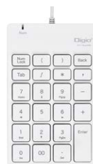
TNK-SU228W 有線静音テンキー / ホワイト (4902205484301)