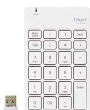
TNK-SR227W 無線静音テンキー / ホワイト (4902205484288)