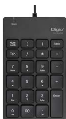
TNK-SU228BK 有線静音テンキー / ブラック (4902205484295)