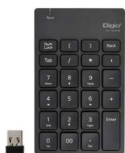
TNK-SR227BK 無線静音テンキー / ブラック (4902205484271)